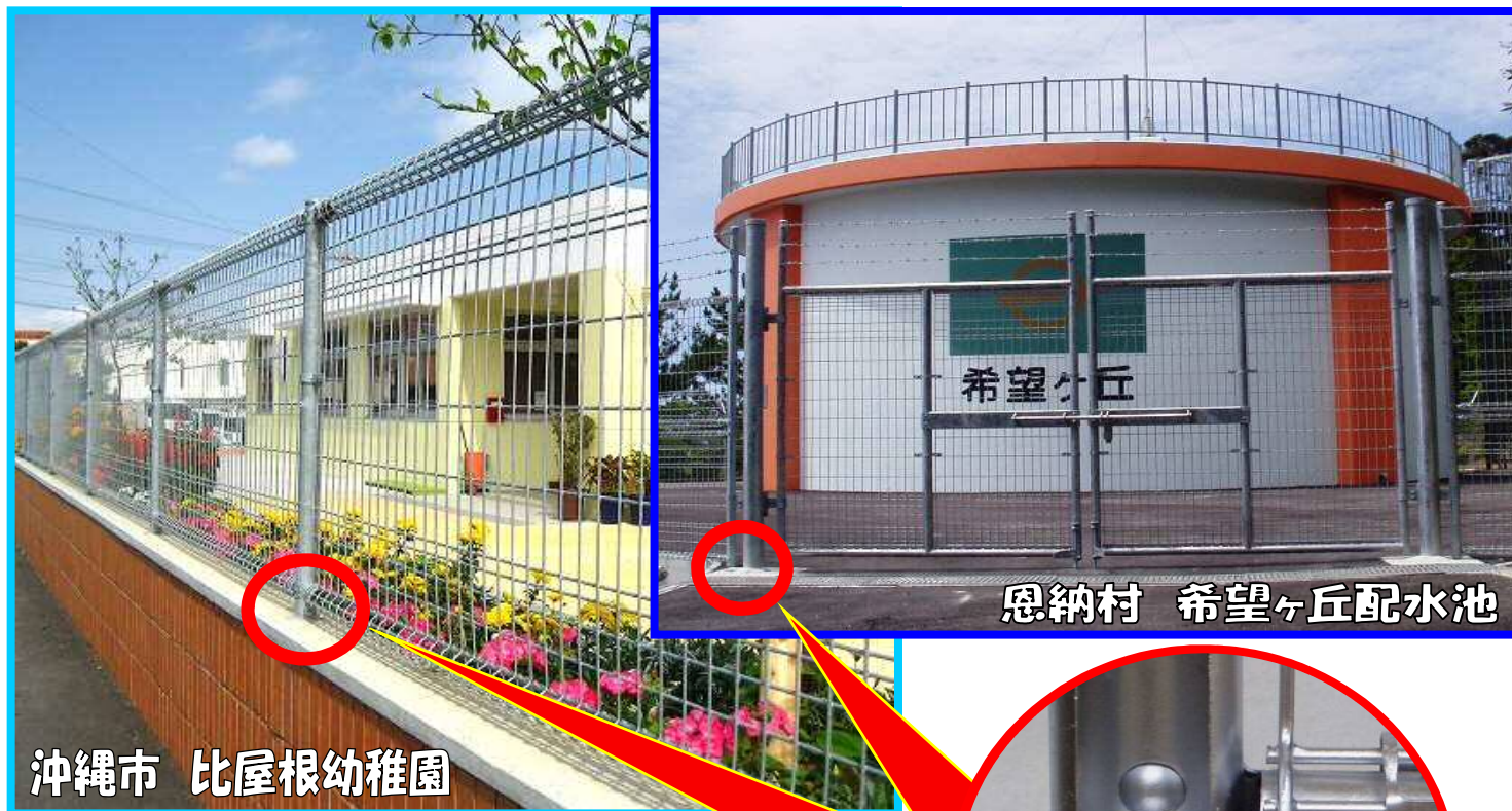
沖縄市 比屋根幼稚園