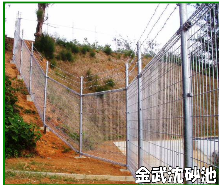
傾斜フェンス (有刺鉄線忍び)