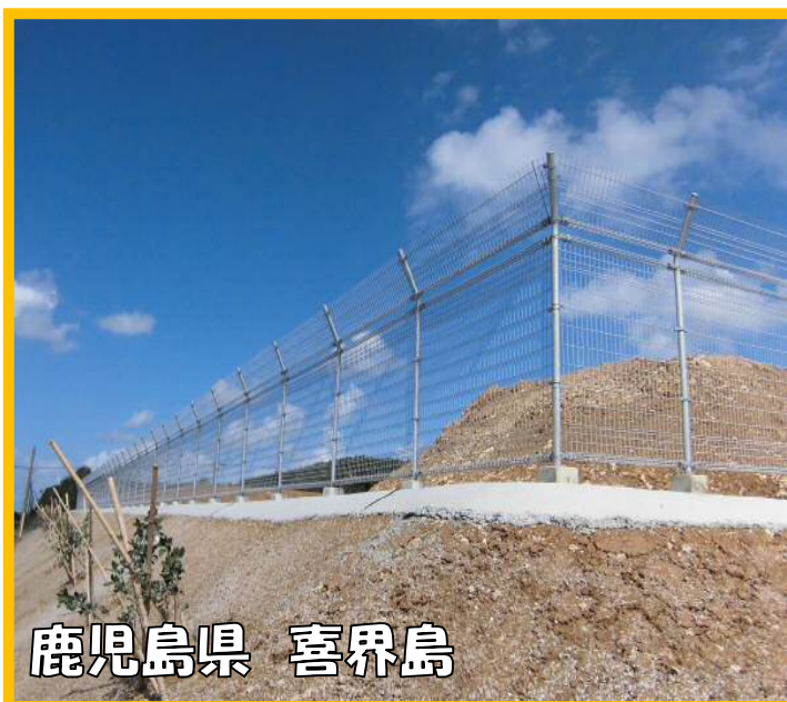
パネル忍びタイプ