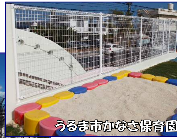
うるま市かなさ保育園